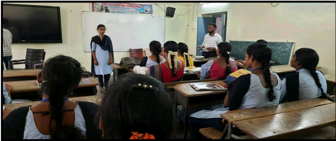
Students Feedback on Workshop