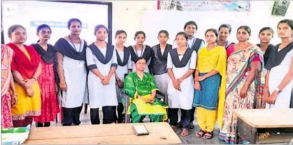
శిక్షణ పొందిన విద్యార్థులతో అధ్యాపకులు