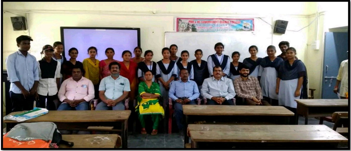
Principal, Staff and Student Participants